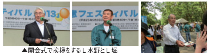
▲開会式で挨拶をするL水野とL堀